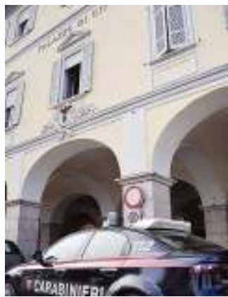
I carabinieri ieri in municipio