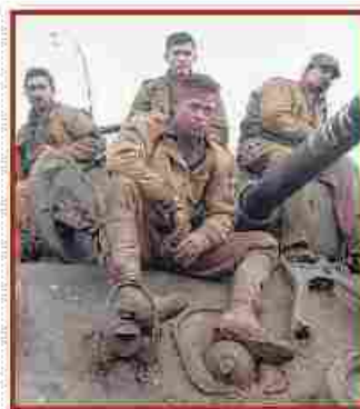
Una scena dal film «Fury»

MOVIE PLANET MULTISALA // info: 0321 - 987.046 / 988.872 - Per prenotare: 0321 - 92.74.19 / 89.95.52.578 www.movieplanetgroup.it SALA 1 Fuga in tacchi a spillo, orario 15,10; 17,30; 20,10; 22,30 SALA 2 Fury, orario 16,30; 19,40; 22,30 SALA 3 Jurassic world (3D), orario 15; 17,30; 20; 22,30 SALA 4 La regola del gioco, orario 15; 17,30; 20; 22,30 SALA 5 Jurassic world, orario 15; 17,30; 20; 22,30 SALA 6 Torno indietro e cambio vita, orario 15; 17,30; 20; 22,30 SALA 7 Unifreddo, orario 15,10; 17,30; 20,10; 22,30 SALA 8 Albert e il diamante magico, orario 15,10; 17,30 La risposta è nelle stelle, orario 19,40; 22,40