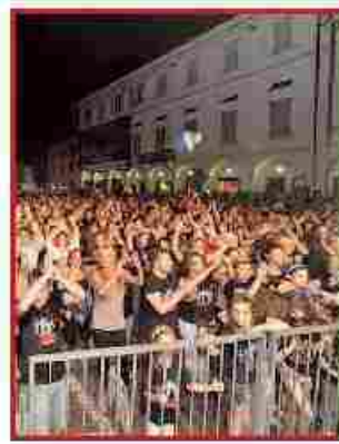
Si balla in piazza