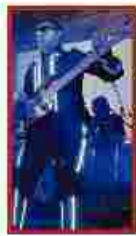
Time Travel Uno dei componenti della band che propone uno spettacolo di grande suggestione

«Comignago s'accende» propone oggi musica, animazione, gastronomia e bancarelle per le vie di Comignago. Si inizia alle 10, con l'apertura degli stand e la mostra fotografica che racconta storie e personaggi del paese. A pranzo tris di risotti, preparati da un rinomato chef, e grigliata. Ci saranno laboratori e giochi per bambini. Si ballerà sulle note della musica irlandese con i «Kelly folk» e l'associazione sportiva «Twirling Santa Cristina» proporrà un'esibizione. Aperitivo in musica con i «Wineblood» prima della cena con la pizza cotta nel forno a legna e gran finale con il concerto dei «Time travel» con suggestivi effetti speciali. [C.F.A.]