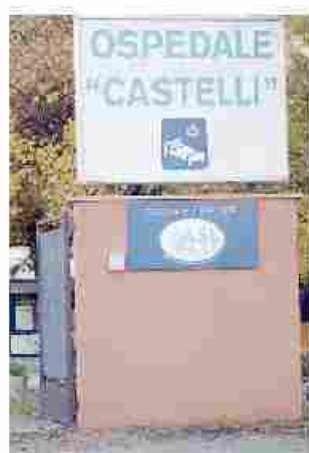
L'attuale ospedale di Verbania