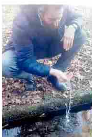
Il sindaco Giuseppe Maio

PUBLIKOMPASS S.P.A. BIELLA, VIA COLOMBO 4 TEL. 015 2522926 - 015 8353508 FAX 015 2522940